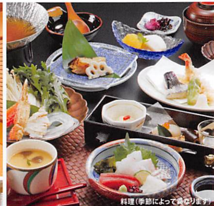
料理(季節によって異なります)