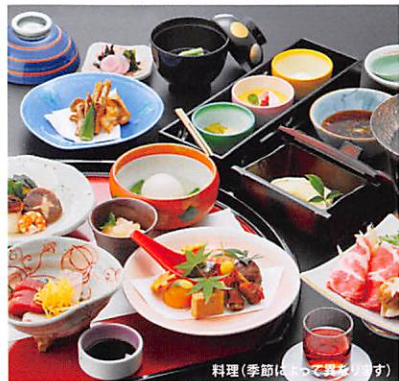
料理(季節は、違ってきます)

〒879-5114 大分県由布市湯布院町川北字高原894-61 TEL.0977-85-2441 FAX.0977-85-2681