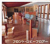
フロント・ロビーフロア