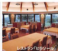
レストラン「ヒラソール」