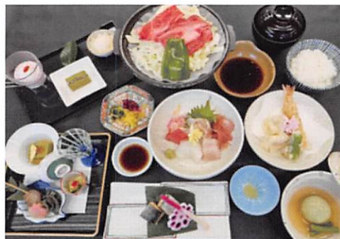
あじわい料理(季節によって異なります)

〒299-5245 千葉県勝浦市興津1514-12 TEL.0470-76-5100 FAX.0470-76-5104