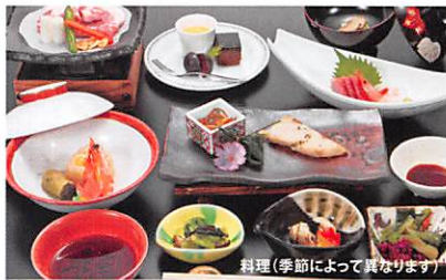
料理(季節によって異なります)

〒325-0301 栃木県那須郡那須町大字湯本206 TEL.0287-76-2559 FAX.0287-76-1947