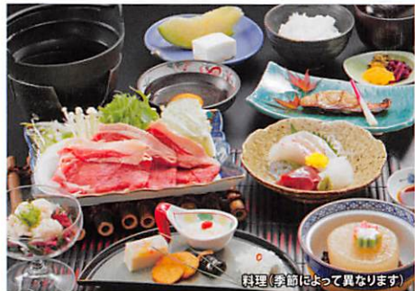
料理(季節によって異なります)