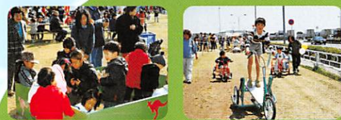
ふれあい広場 春(ゴールデンウィーク)に開催