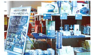
人気の大洗ブランドコーナー

大洗町のイメージ・特色ある地域資源を活用し、優れた農産物、水産物および加工品を大洗ブランドとして認証し、これまで観光色の強い本町に「食」のイメージを融合させ、更なるイメージアップと地域活性化を図ることを目的としております。