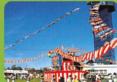
盆踊りのタバ大洗 8月に開催