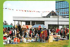
大フリーマーケット「青空市」 毎月第1、第3日曜日に開催 (8月、1月は除く)