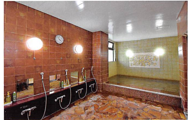
●大浴場 旅のつかれをいやして 一日のフィナーレを思う。

梅屋の魅力は、旬な食材を活かしながら細部まで こだわって作るお料理の数々。梅屋の料理人が 一皿一皿、真心込めてお料理をお作り致します。