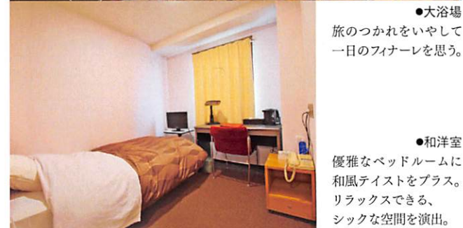
●和洋室 優雅なベッドルームに 和風テイストをプラス。 リラックスできる、 シックな空間を演出。