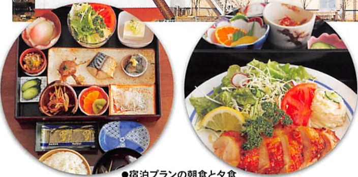
●宿泊プランの朝食と夕食

当ホテルは常磐自動車道谷田部インター・ 圏央道つくば中央インターから近く、ビジネス、 又レジャーユースにも格好の場所でございます。