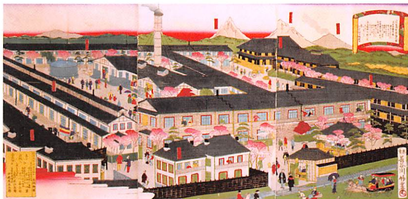
錦絵 上州富岡製糸場之図（富岡市立美術博物館・福沢一郎記念美術館所蔵）