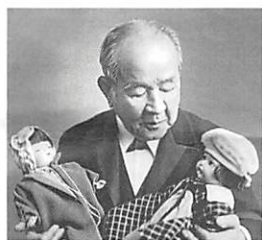
青い目の人形を抱く栄一*

日米関係の悪化に心を痛めていた栄一に、アメリカから、人形による国際交流を行い日米友好を図りたいという提案がありました。栄一は日本政府へ協力を働きかけるとともに「日本国際児童親善会」を組織し、アメリカ側から約13,000体の「青い目の人形」を受け入れました。この人形は全国各地の小学校へ送られ、大歓迎を受けました。