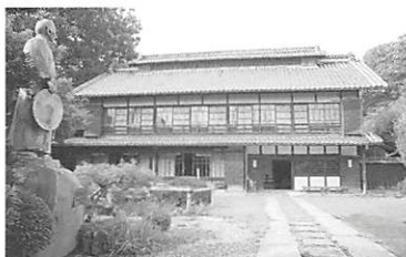
渋沢栄一生地 旧渋沢邸「中の家」 なかんち

最初は栄一を相手にしなかった農家の人たちも、「この葉は肥料が足りないね。これは乾燥が不十分だね。」と言う大人顔負けの鑑識眼に驚き、栄一は土質の葉を安く仕入れました。