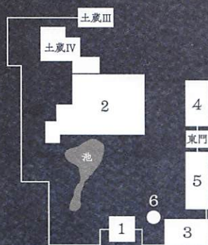
1. 正門・青洲翁誕生之地碑 (幸田露伴書)