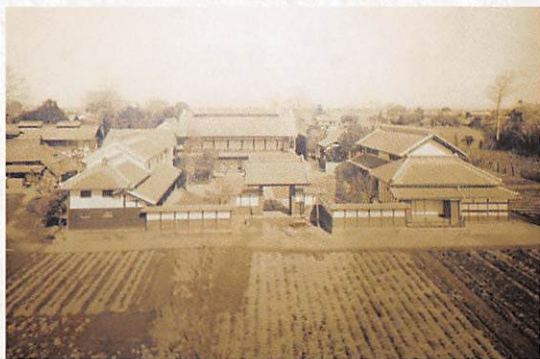
渋沢邸「中の家」全景

主屋を囲むように副屋、土蔵、正門、東門が建ち、この地方における養蚕農家屋敷の形をよくとどめている。