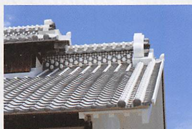
屋根に施された化粧漆喰