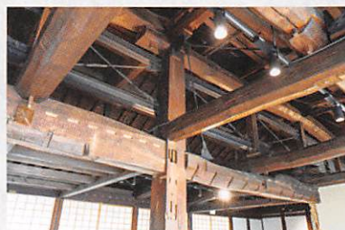
大黒柱周りの耐震補強の様子