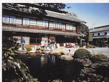
渋沢国際学園時代の「中の家」（昭和60年以降）

「近代日本経済の父」と称される渋沢栄一を生んだ「中の家」は、当主が代々市郎右衛門を名乗る、畑作や養蚕を営む農家であった。栄一の父、市郎右衛門（元助）は、藍玉の製造・販売を家業の中心に財産を築き、「苗字帯刀」を許されるほど裕福になった。