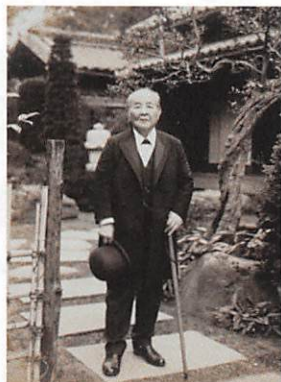
渋沢栄一「中の家」にて(昭和2年)

晩年の栄一は、幼少期に自身も親しんだ血洗島獅子舞の観覧を楽しみに、獅子舞が奉納される諏訪神社の祭礼にあわせて帰郷して「中の家」に滞在した。東京飛鳥山の栄一の私邸は、空襲によって焼失したため、この家は現在残る栄一が親しく立ち寄った数少ない場所といえる。