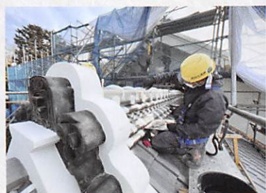
屋根化粧漆喰施工

上棟から120年以上を経た主屋を未来へと遺し伝えていくため、令和元年度に着手した整備が、令和5(2023)年4月末に竣工した。プロポーザル方式による厳正な選考を経て、設計・施工を一体的に担ったのは、栄一にゆかりの深い清水建設で、文化財としての価値を保ちながら耐震安全性の向上が図られた。整備では、耐力壁の集約配置や腐朽部材の交換、新たな基礎の打設、補強金物の設置を行い、渋沢国際学園時代に大きく改築された北側部分には渋沢栄一アンドロイド・シアターを設置した。さらに、資金の一部をクラウドファンディングにより集めて葺き替えた屋根は、化粧漆喰と寄附者の記名瓦を冠して完成した。