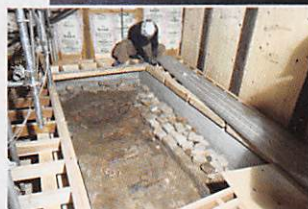
確認された 煉瓦製カマド跡を保存