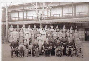
「中の家」主屋前集合写真（大正末～昭和初期）