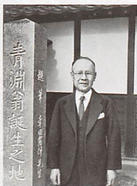
「青淵翁誕生之地」と元治 「五十年間の回顧」より