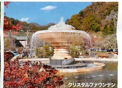
クリスタルファウンテン