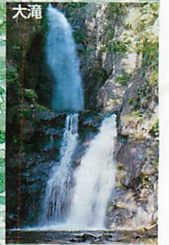
秘境「板敷渓谷」を約6分歩くと、高さ30mの華麗な幻の滝に出会えます。 Otaki After 6 minutes walk in Itajiki keikoku, you can see a magnificent 30m water fall.

昇仙峡の谷間に広がる雄大な荒川ダムは甲府市の上水道の供給と、洪水調整の多目的ダムで貯水量1,080万トンのロック式ダムです。 Arakawa dam Arakawa dam is located in Okushosenkyo valley, and was built as a water reservoir. It holds 10.8 million tons of water.