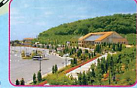
7 淡路ハイウェイオアシス