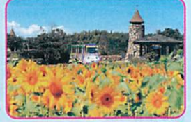
36 淡路ファームパーク イングランドの丘