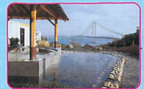
2 美湯 松帆の郷