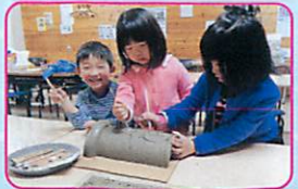
66 淡路島かわらや「安富白土瓦」