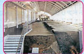
80 北淡震災記念公園 (野島断層保存館)