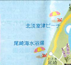
74 淡路市立 香りの公園