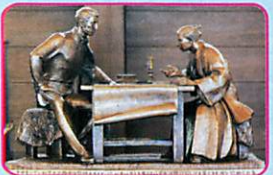
72 高田屋嘉兵衛公園 高田屋顕彰館「菜の花ホール」