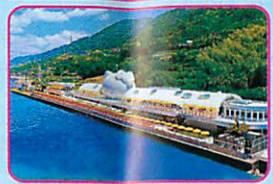
© 1976, 2019 SANRIO CO., LTD. APPROVAL NO. G601986