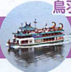
鳥羽湾めぐりとイルカ島

本券ご持参の方、1枚につき5名様まで運賃を大人100円 小人50円割引させていただきます。