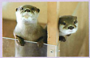
カワウソ姉妹「りん・らん」

鳥羽マリンターミナルと真珠島・水族館前のりばから出航する遊覧船は鳥羽湾に囲まれたイルカ島(入園無料)へ寄港する遊覧コース。イルカ島ではイルカやアシカのショーをはじめ、イルカとのふれあい体験、可愛いカワウソ姉妹もご覧いただけます。また、山頂へ上れば鳥羽湾だけでなく伊勢湾、遠くは愛知県の知多・渥美半島まで望める鳥羽のビューポイントの一つです。