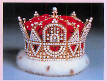
パールクラウンII世

明治26年(1893)、御木本幸吉が世界で初めて真珠の養殖に成功した島。真珠の魅力を様々な角度から紹介する真珠博物館をはじめ、御木本幸吉記念館、パールプラザ(ショップ・レストラン)などがあります。また、美しい鳥羽湾を舞台に繰り広げられる海女の実演も見逃せません。