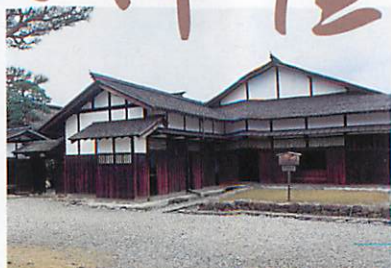
寺院・町年寄・町組頭詰所(写真左側の建物)