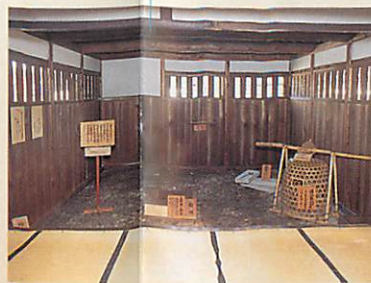
吟味所・御白洲(南)

広間は三室に分かれており、公式の会議等に使用されました。書院造りのこの部屋からは、濡縁を通して庭が見わたせます。文化13年(1816)に改築されたものです。