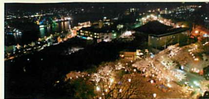
頂上展望台からの夜景

ぐるっと360度、尾道の大パノラマが広がります。尾道に来たら立ち寄ってみたいビュースポットです。