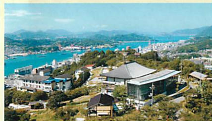
頂上展望台からの眺め