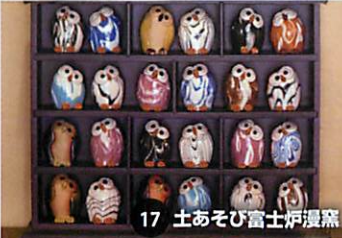
17 土あそび富士炉湯蒸