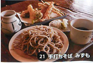
21 手打ちそば みずも