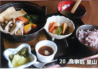
20 食事処 里山