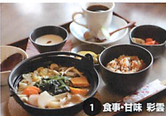
1 食事・甘味 彩雲