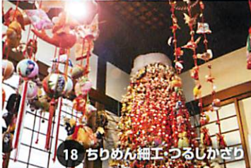
18 ちりめん細工・つるしかざり