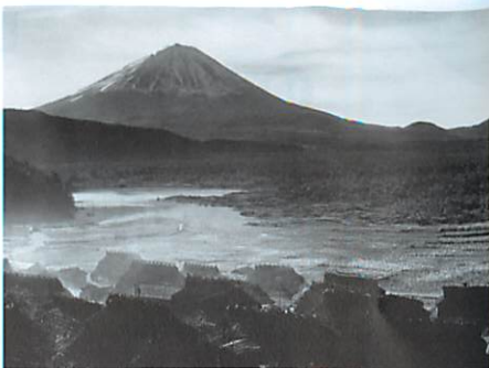
【写真:岡田紅陽撮影の昭和13年の根場集落と富士山】

西湖畔の西北に位置する根場地区は、かつて「かぶと造り」の茅葺民家が建ち並ぶ、誉れ高い集落でした。昭和41年の台風災害により甚大な被害を受け、集落のほとんどが消滅してしまいました。40数年の歳月を経て、昔懐かしい茅葺き屋根群と富士山の景色が甦り、地域の歴史や文化、自然環境を舞台とした「西湖いやしの里根場」が誕生しました。