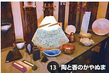
13 陶と香のかやめま