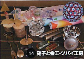
14 硝子と金工・ツバイ工房