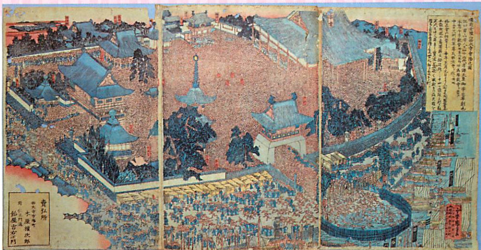
西大寺會場の浮世絵 (岡山県立博物館蔵)