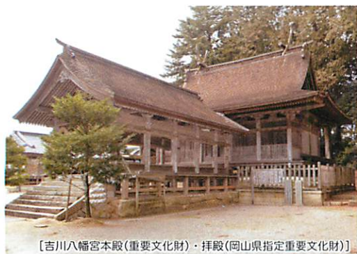
[吉川八幡宮本殿(重要文化財)・拝殿(岡山県指定重要文化財)]

開催日：10月第3土・日曜日、 10月第4土・日曜日(大祭)、 10月第5月曜日 (10月1日の神事は非公開)