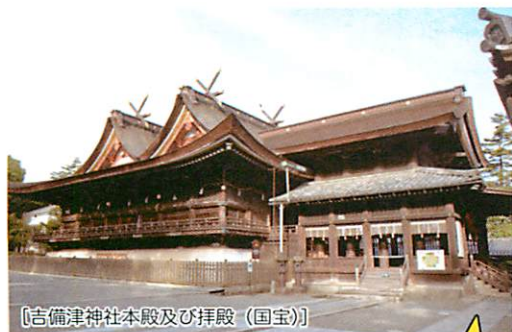
〔吉備津神社本殿及び拝殿（国宝）〕

簡単な動作をゆっくりと踊ることに特徴があり、優美な中に厳格さを感じさせる踊りとなっています。