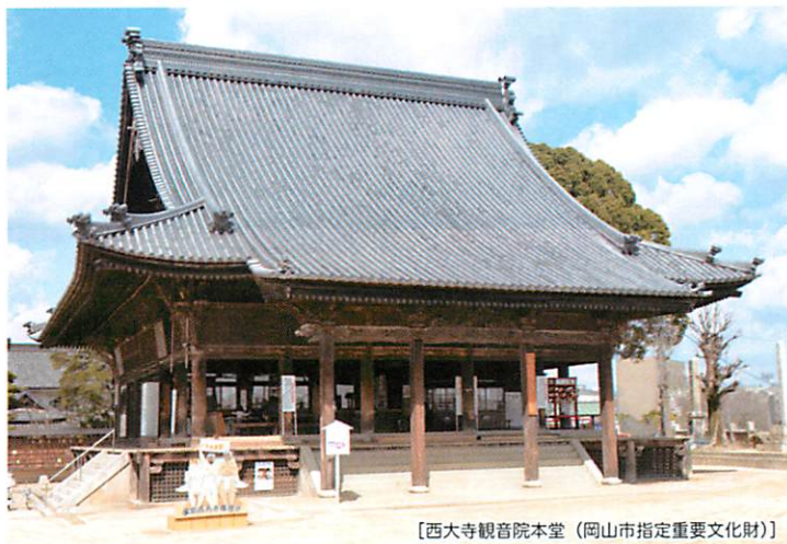
[西大寺観音院本堂 (岡山市指定重要文化財)]