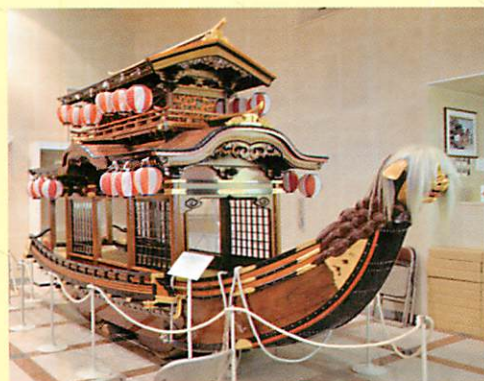
【左上】津山だんじり 【右】八浜のだんじり 【下】牛窓だんじり