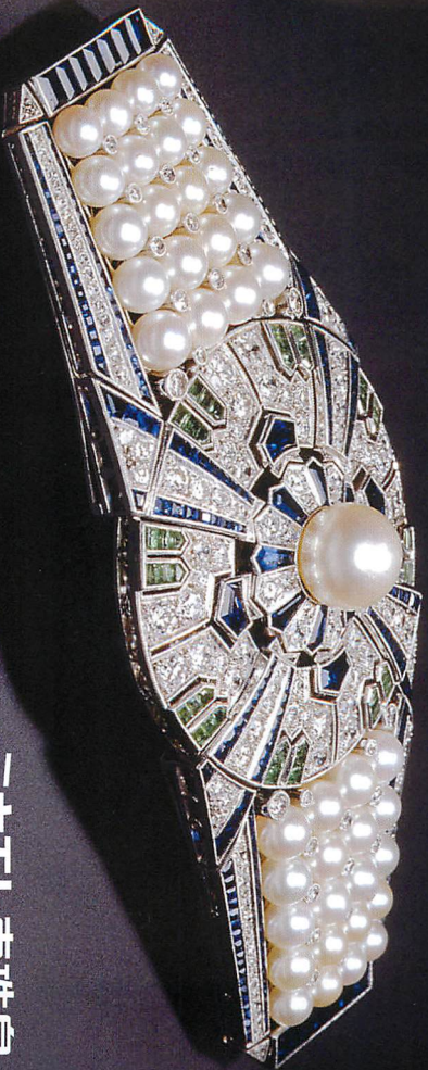
带留「矢車」 Sash Clip "YAGURUMA"