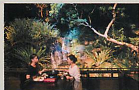
幻想的な空間で、琉球コース料理やアグーのしゃぶしゃぶ、石垣島牛のしゃぶしゃぶを堪能。