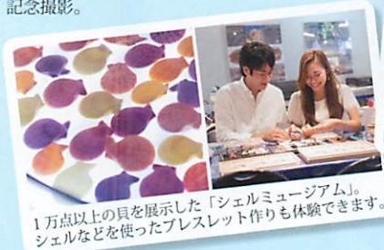
1万点以上の貝を展示した「シェルミュージアム」。シェルなどを使ったプレスレット作りも体験できます。