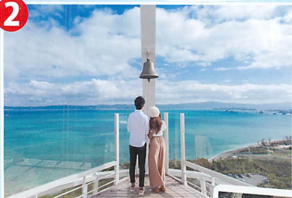
絶景をバックに頂上で幸せの鐘を鳴らし、記念撮影。