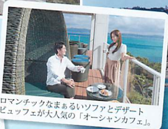
ロマンチックなまあるいソファとデザートビュッフェが人気の「オーシャンカフェ」。

タワー最上階から眺める古宇利ブルーの海の絶景、その美しさは一生忘れることはないでしょう。