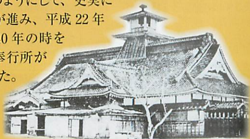
箱館奉行所古写真

函館市では、郭内の建物が失われて五稜郭の本来の姿が理解されにくい状況が続いていたことから、箱館奉行所の復元を主とした五稜郭の史跡整備を計画しました。昭和60年(1985)から発掘調査を始め、古写真や文献資料・古図面などの調査を基に奉行所復元の検討を重ね、平成18年(2006)から工事が開始されました。このようにして、史実に忠実な復元が進み、平成22年(2010)に140年の時を超えて箱館奉行所が再現されました。