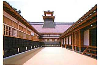
中庭から見上げる太鼓櫓