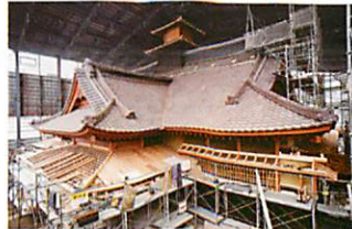
瓦葺きの完成 (平成 21 年 4 月)