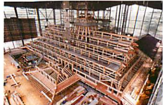
建築途中の奉行所 (平成 20 年 7 月)

箱館奉行所の復元工事は平成18年に着工し、4年後の平成22年に完成しました。復元範囲は奉行所庁舎全体のおよそ1/3にあたる約1,000㎡で、全国から結集した宮大工などの職人による日本伝統建築の匠の技により、当時の姿が再現されました。