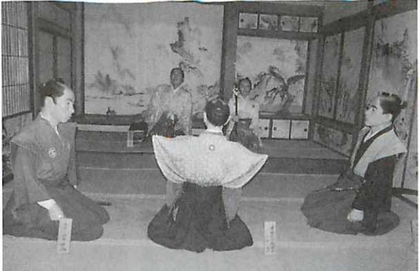
大次郎英才の誉れ高く11才で藩主の御前で武教全書の講義をする