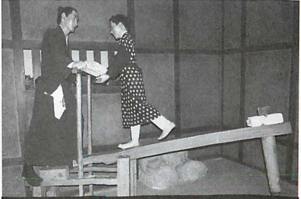
松陰・松下村塾を開設、その至誠みなぎる囚人教育は多くの子弟の感動を呼ぶ