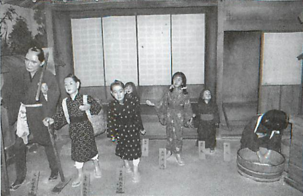
松陰の生家、父は毛利藩の下級武士、貧しかったが学問好きの一家

明治維新——それは日本の歴史初まつて以来最大の政治改革であった。徳川三百年の幕藩体制を打倒し、封建日本から近代的統一国家への建設へ——と凄まじい闘争が初まった。尊攘から倒幕へ、王政復古へ、動乱の渦は全国に波及してゆく、その明治維新の誕生の地は毛利藩の萩、その中心人物は若い吉田松陰であった。 吉田松陰の略歴 天保元年（一八三〇）八月四日萩藩士杉百合之助常道の二男として萩の東郊護国山団子巖に生れた。名は矩方、通称は虎之助、大次郎、松次郎、寅次郎と度々改めた。号は松陰又は二十一回孟士として知られている。 数え年五歳の時藩の山鹿流兵学者であった叔父吉田大助の養子となり、翌年叔父が死んだので家督を相続した。それよりのち家学大成のため勉学にはげんだ。 二十一才、平戸、長崎に遊学、西欧文化の一端にふれ、大いに啓発される。 翌年、藩主の江戸出府に随行、当時随一の西洋学者佐久間象山の塾に学ぶ。阿片戦争の詳細を知り、西欧の東洋侵略、日本に及ぶの恐怖を痛感する。 同年、無断にて東北地方を遊歴し、脱藩の罪にて、土籍、世禄を剥奪・閉居を命ぜられる。藩公から特に十年の遊学を許されて、江戸に行き、再び、佐久間象山に学ぶ。国を救う為には、西欧の事情を知るにしかずと国法を冒して決死の密航を企てたが失敗、自首萩の野山獄になされる。 そこで松陰は世にも不思議な囚人教育が始まった。門下生各自の可能性を引き出す独特の教育であった。彼の思想の根底にあるものは、外夷に対する祖国愛であり、貧しい日本を、おかれている日本を強くしなければならぬという富国強兵策であり、時勢への開眼であった。 松陰は世界の大勢をとき、日本の行く可き道を教えようとした。学問が現実と遊離しては存在しないし、あつてはならないといた。 この教育がその子弟を奮いおこさせた。日本の改造・革新へ——明治維新へと突き進む。 学問から実践へ、その政治活動は安政の大獄への連座となり、江戸送り、小塚原で斬られた。行年僅か数えの三十才。明治の日本をつくった偉人の多くは吉田松陰の門下生、高杉晋作・久坂玄瑞・吉田稔麿・前原一誠・伊藤博文・山県有朋・野村靖等有名である。