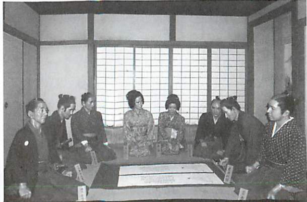
松陰、尊皇倒幕を企て、安政の大獄で江戸送り杉家での最後の別れの宴