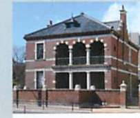
7 旧下関英国領事館