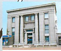
3 中国労働金庫下関支店