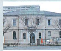
4 下関南部町郵便局