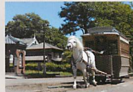
馬車鉄道(4~11月限定) レトロな建物が並ぶ街並みを国内唯一の馬車鉄道が走る。