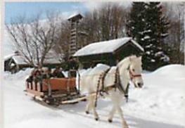
馬そり(12~3月の土日祝日、さっぽろ雪まつり期間のみ限定)

馬車鉄道・馬そり乗車料 大人(15才以上)250円、小人(3才~14才)100円 ※天候等により運休する場合があります