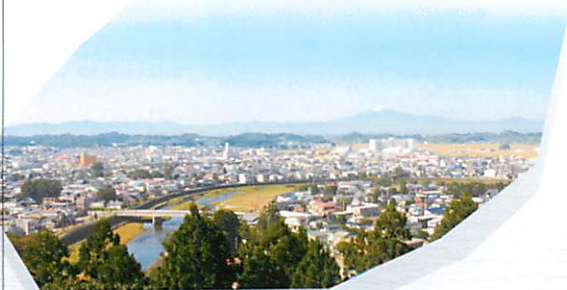
4階展望室からの眺望

昭和40年11月、二の丸跡に郷土資料館を兼ねた四層の天守閣様式の展望台を建設。以来、年に数回展示品を変えながら公開しています。