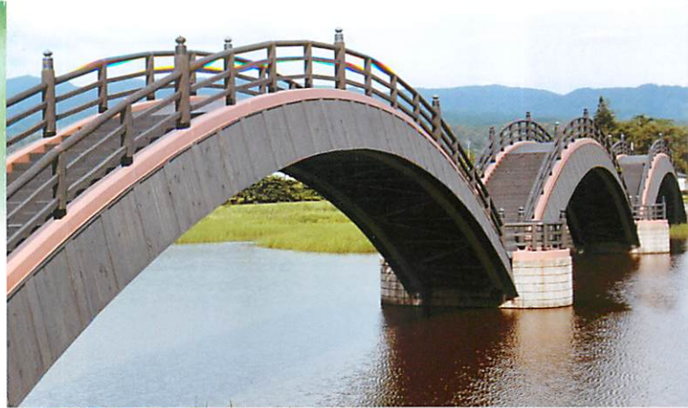
平安の風わたる公園 (後三年合戦 古戦場)