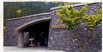
男鹿の寒風山で採石される男鹿石を多用した石造りの外観

大晦日の男鹿のナマハゲ行事を15分の映画で紹介 毎日00~15分と30~45分に上映