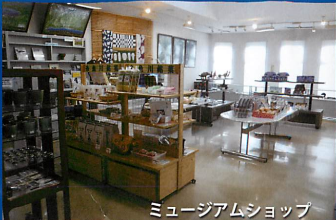
ミュージアムショップ

ミュージアムショップでは、糸魚川産ヒスイ製品をはじめ、当ショップ限定のヒスイ書籍やジオパーク書籍、オリジナル製品、糸魚川銘菓を各種取り揃えております。