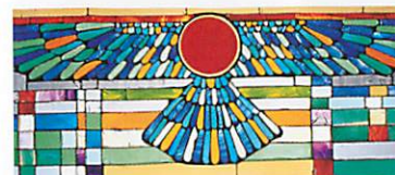
火の源流 アフラ・マズダ ステンド・グラス並河彩制作

商売繁盛、家内安全、大漁満足、縁談成就等の神々で、観音の慈愛により七難即滅、七福即生をうけられます。