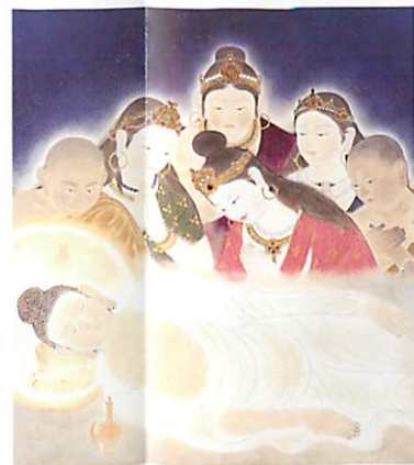
壁画涅槃 関口正男氏画

釈尊の教えのもとに、近代日本仏教の源流と言わべき各宗の開祖をお祀りしております。