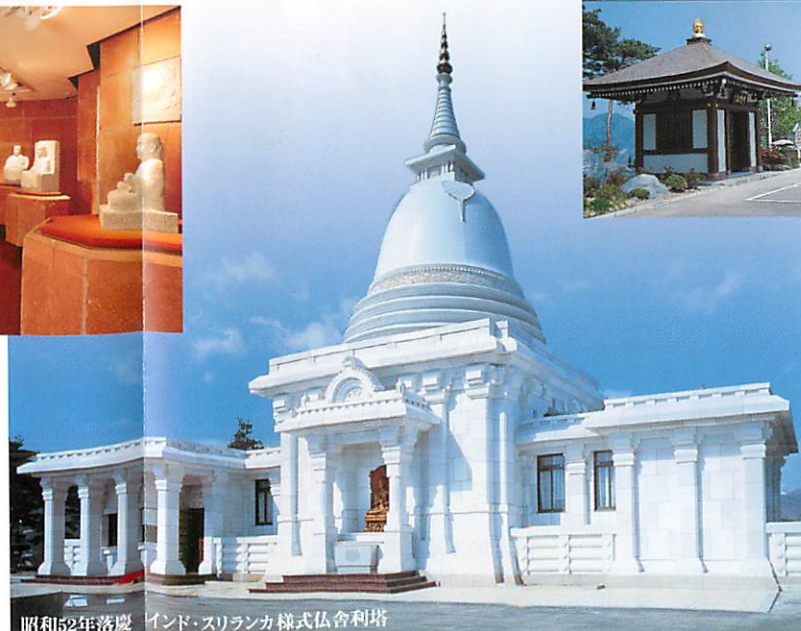
昭和52年落慶 インド・スリランカ様式仏舍利塔