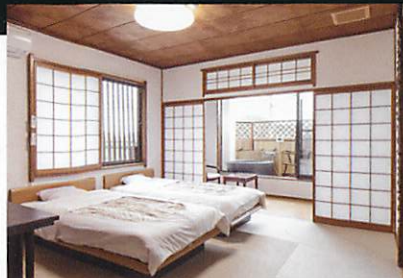
露天風呂付き客室

観光の拠点としてはこちら、宴会場、お食事処をはじめとした設備も完備し、幅広い用途でご利用いただけるホテル浦嶋荘。恵まれた景色と、家庭的な真心で満ち足りた時間をお約束いたします。