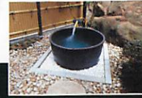
貸切風呂「玉手箱の湯」

ゆったりとした、至福の時間を独り占めできる貸切風呂「かめの湯」と「玉手箱の湯」。他にものびのびとゆったり寛げる大浴場、浦嶋荘の自慢のお風呂を満喫ください。