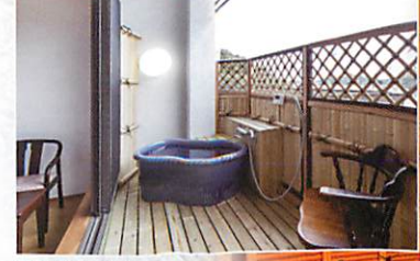
露天風呂付き客室

ゆったりとした、至福の時間を独り占めできる貸切風呂「かめの湯」と「玉手箱の湯」。他にものびのびとゆったり寛げる大浴場、浦嶋荘の自慢のお風呂を満喫ください。