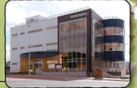
駅前観光交流センター YOMUNOSU～よむのす