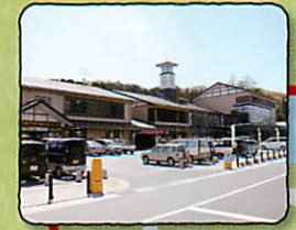
道の駅くじ・やませ土風館