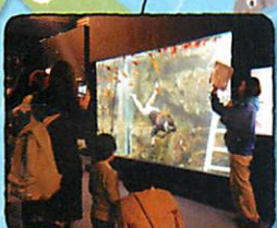
久慈地下水族科学館 もぐらんぴあ

白い灯台 ・若いころの春子が不満を書きなぐった場所 ・アキが自転車で飛び込んだ場所 ・最終回でアキとユイが立つ場所