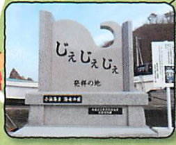
じえじえじえ 発祥の地石碑