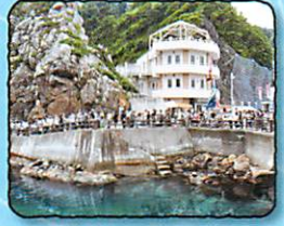
小袖海女センター・夫婦岩