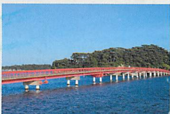
福浦橋 (出会い橋) ▶徒歩7分▶