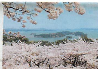
西行戻しの松公園からの眺望

西行法師が諸国行脚の折、松の大木の下で出会った童子と禅問答をして破れ、身を恥じ松島行きを断念し引き返したことが由来。桜の名所で、展望台からは桜と松島湾の景色が一体となった、他に類をみない花見が味わえる。