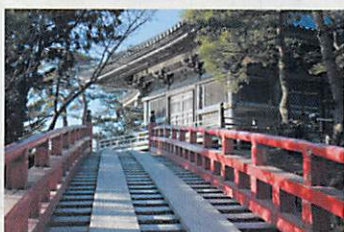
五大堂 (縁結び橋) ▶徒歩7分▶