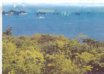
双観山からの眺望

「松島」の地名発祥地。絶好の散策コース。中世より「奥州の高野」として僧侶や巡礼者の修行の場となっており、仏像、法名などが彫られた岩窟や板碑も多く見られる。また、芭蕉を含めた多くの句碑も見逃せない。