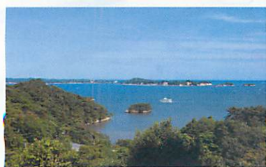
幽観・扇谷 (松島町)

松島湾の入り江が扇を広げたように浮かんで見えることから幽観と称される。紅葉の名所でもある。