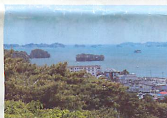
新富山からの眺望

塩釜湾と松島湾の島々を間近にかつ立体的に一望できる。遠く金華山沖からのぼる朝日はまさに荘厳。紅葉の隠れた名所(11月中旬～下旬見頃)