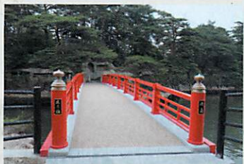
渡月橋 (縁を絶つ縁切り橋) ▶徒歩15分▶