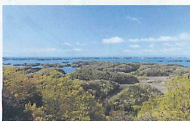
麗観・富山 (松島町)

松島湾の入り江が扇を広げたように浮かんで見えることから幽観と称される。紅葉の名所でもある。