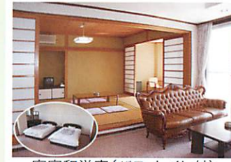
客室和洋室(バス、トイレ付)