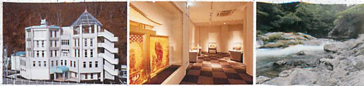
もぐらんぴあ 琥珀博物館 久慈溪流