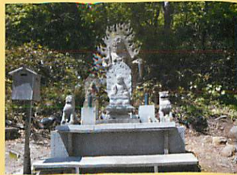
⑨ 奥の院 不動明王