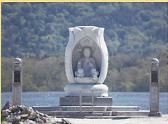
⑬ 東日本大震災供養塔